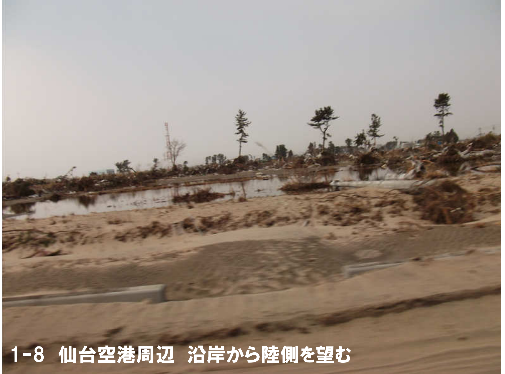
1-8 仙台空港周辺 沿岸から陸側を望む