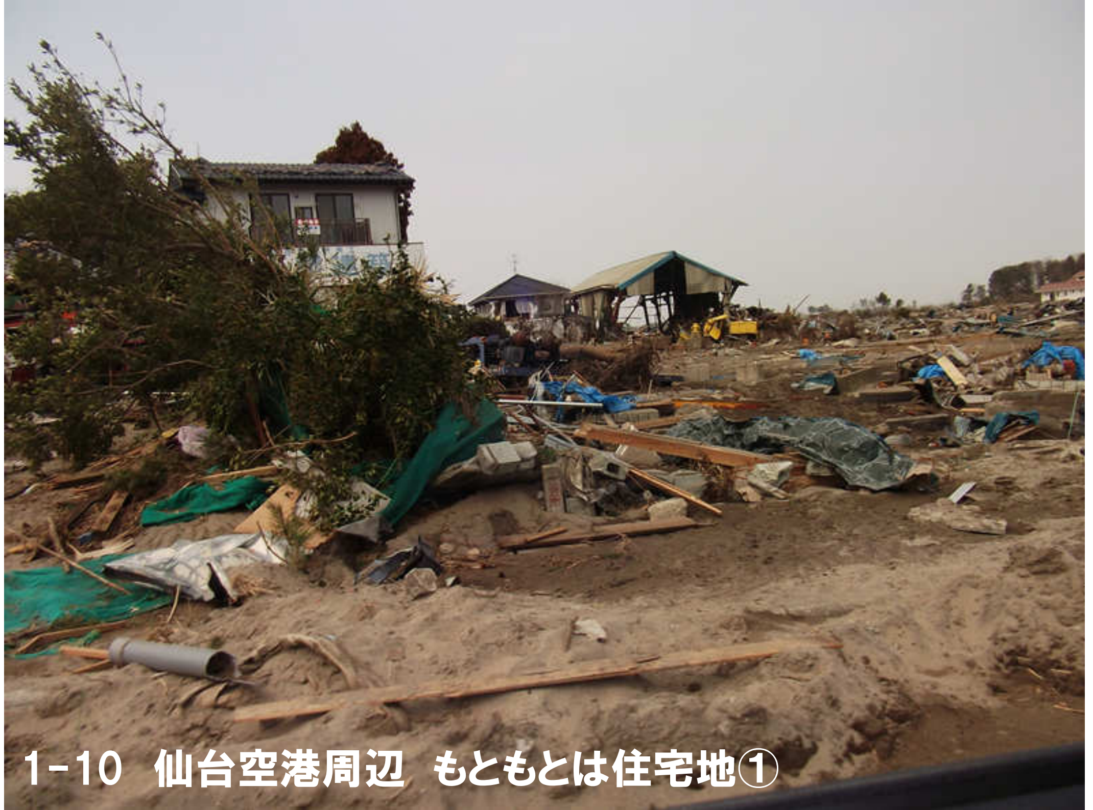
1-10 仙台空港周辺 もともとは住宅地①