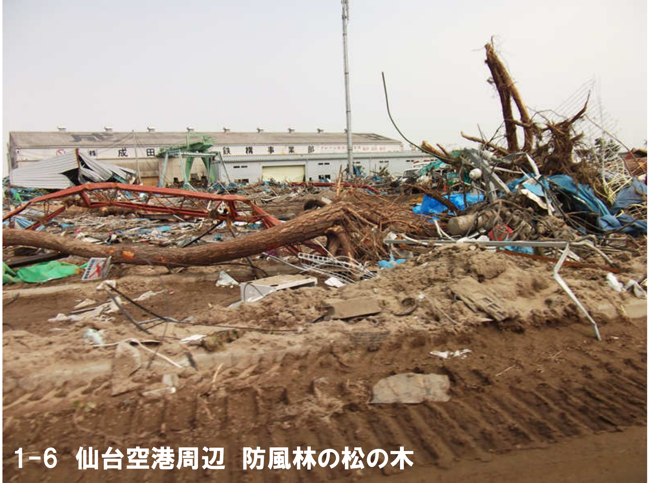
1-6 仙台空港周辺 防風林の松の木