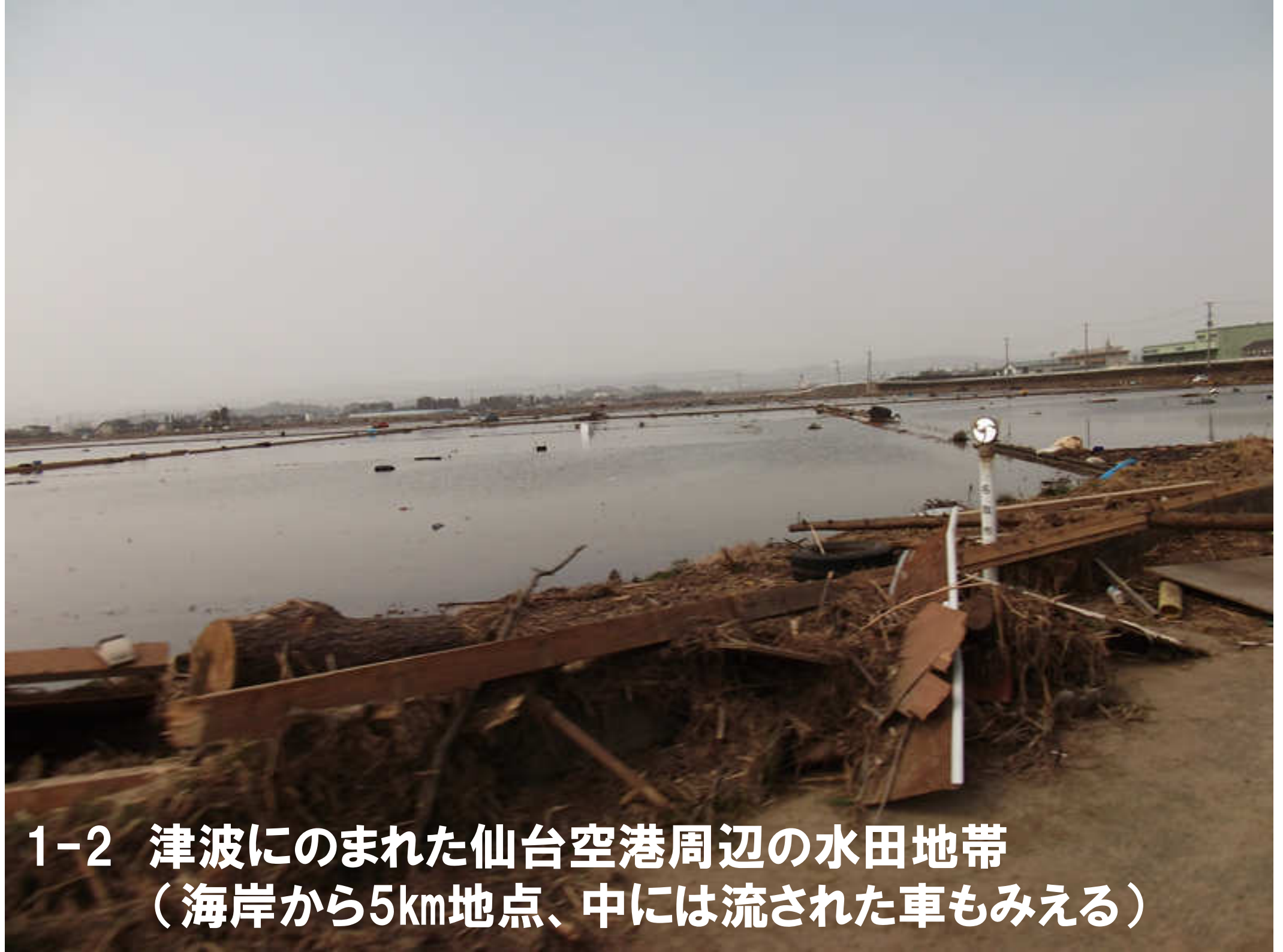
1-2 津波にのまれた仙台空港周辺の水田地帯 （海岸から5km地点、中には流された車もみえる）