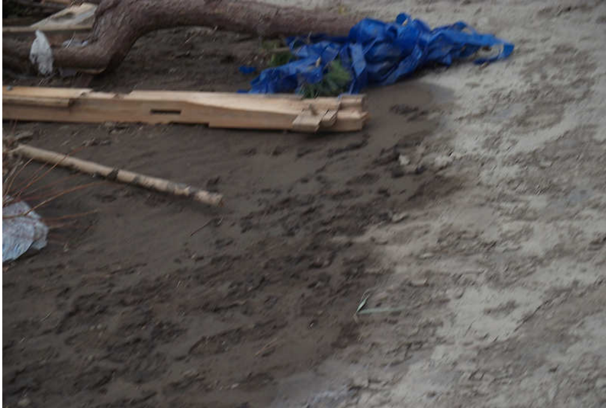
1-20 仙台空港周辺 あたり一面にヘドロが堆積している。