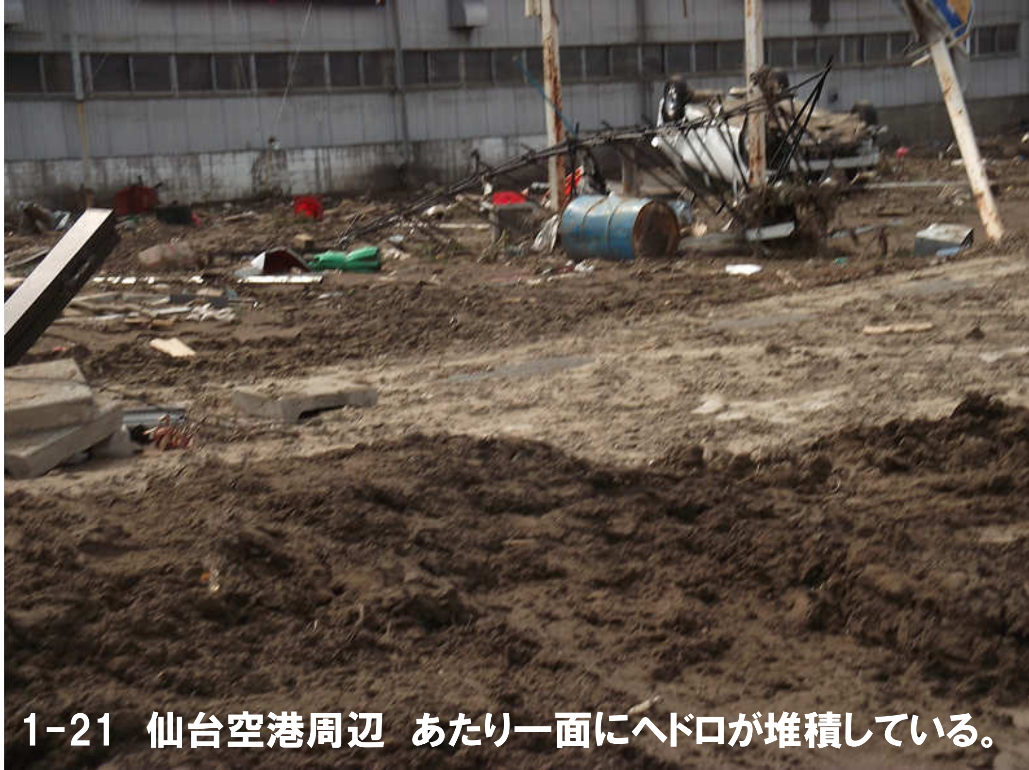
1-21 仙台空港周辺 あたり一面にヘドロが堆積している。