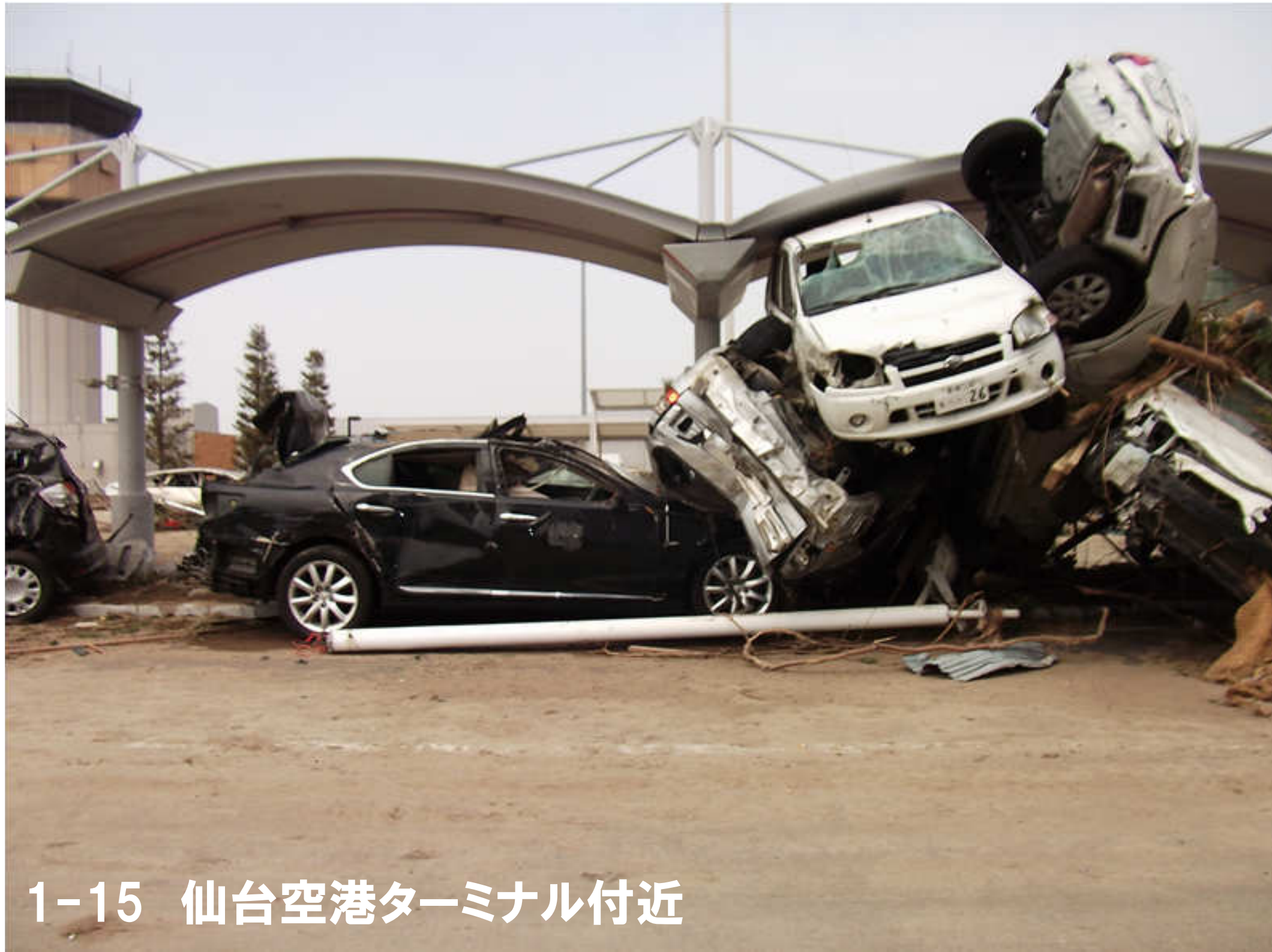
1-15 仙台空港ターミナル付近