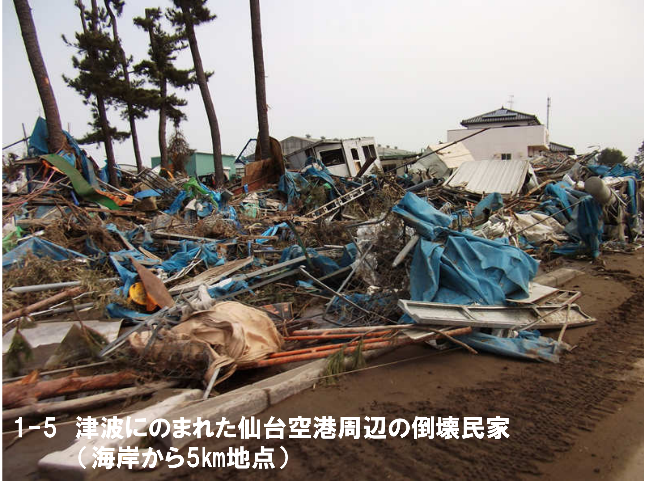
1-5 津波にのまれた仙台空港周辺の倒壊民家 (海岸から5km地点)