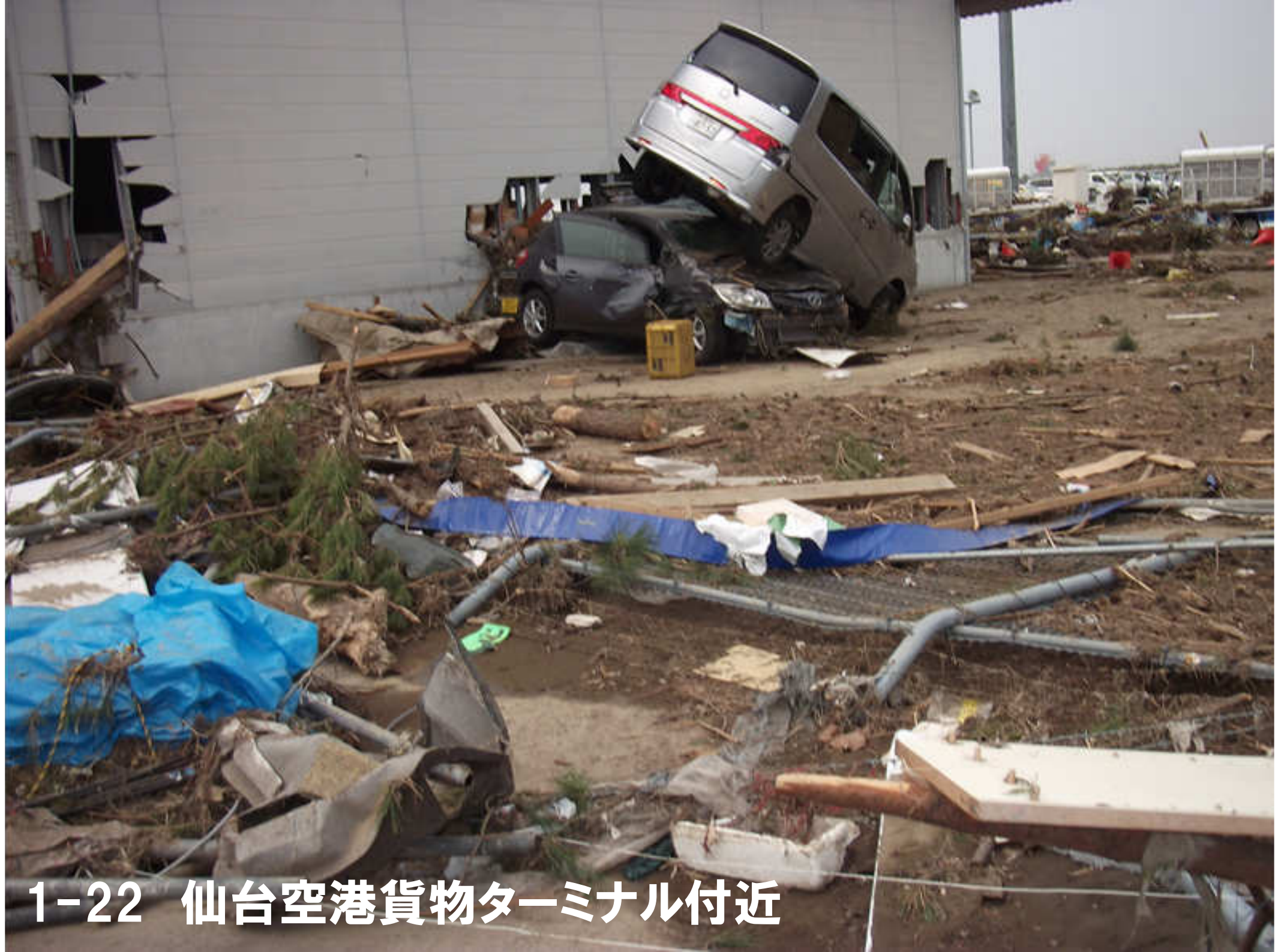
1-22 仙台空港貨物ターミナル付近