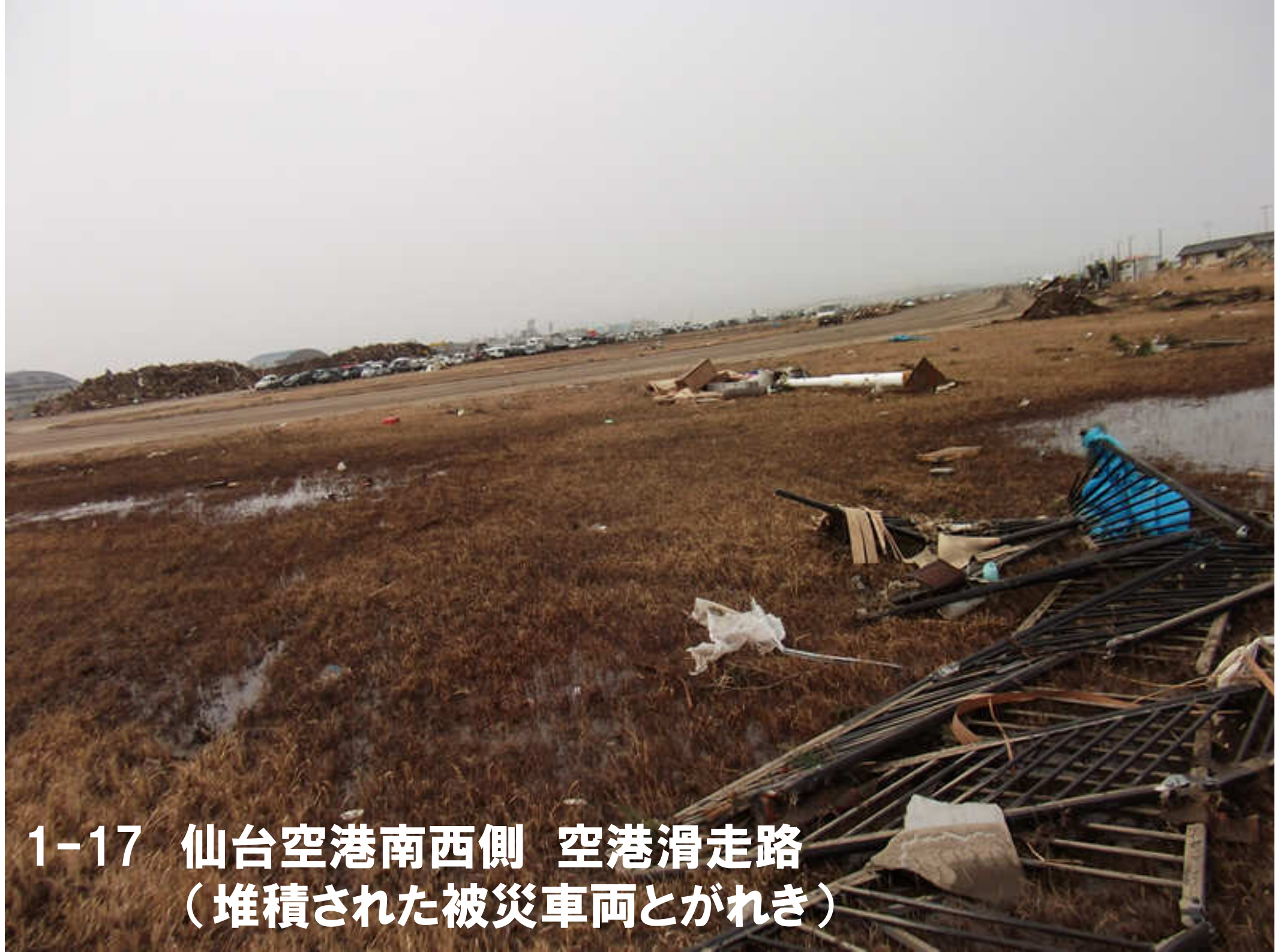
1-17 仙台空港南西側 空港滑走路 (堆積された被災車両とがれき)