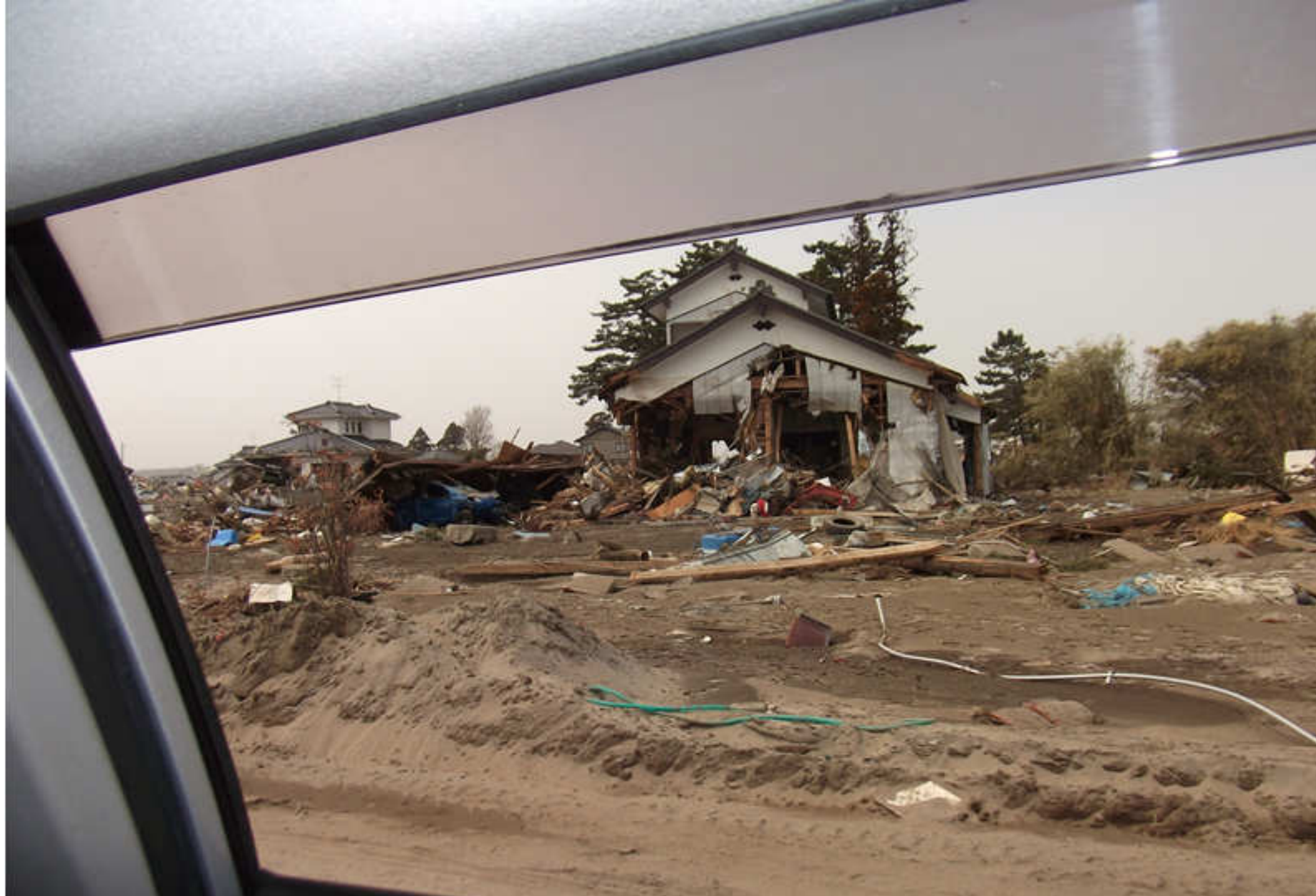
1-11 仙台空港周辺 もともとは住宅地②