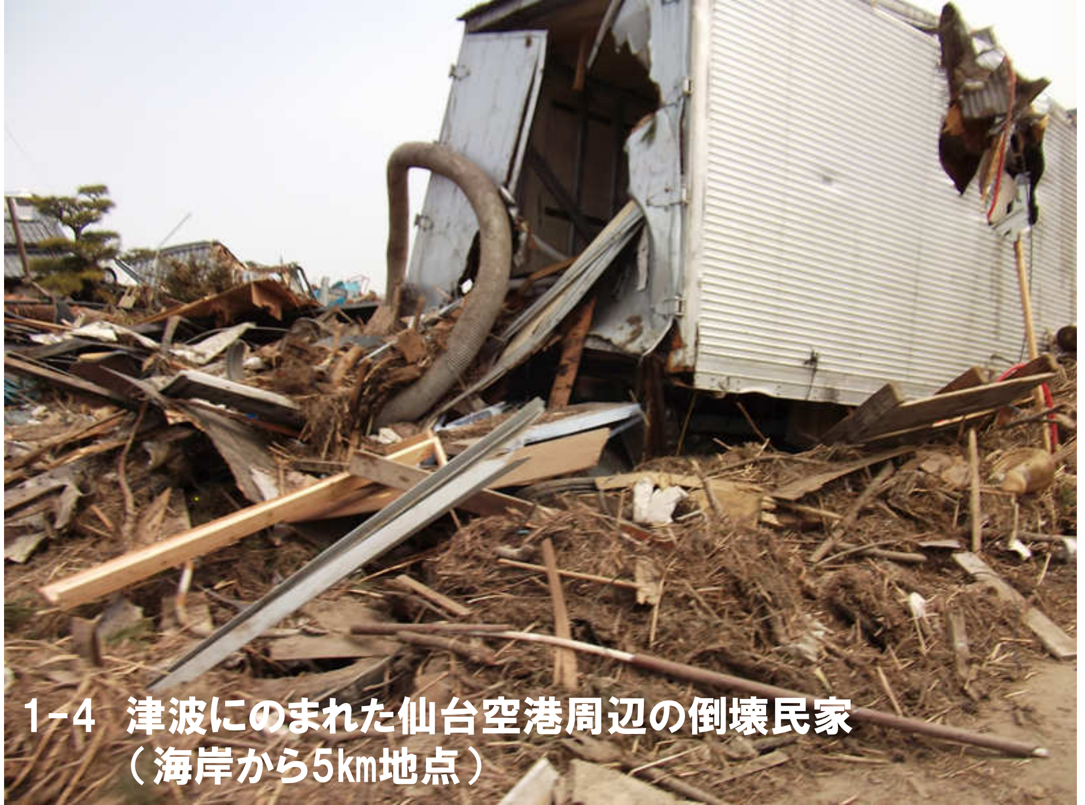
1-4 津波にのまれた仙台空港周辺の倒壊民家 (海岸から5km地点)