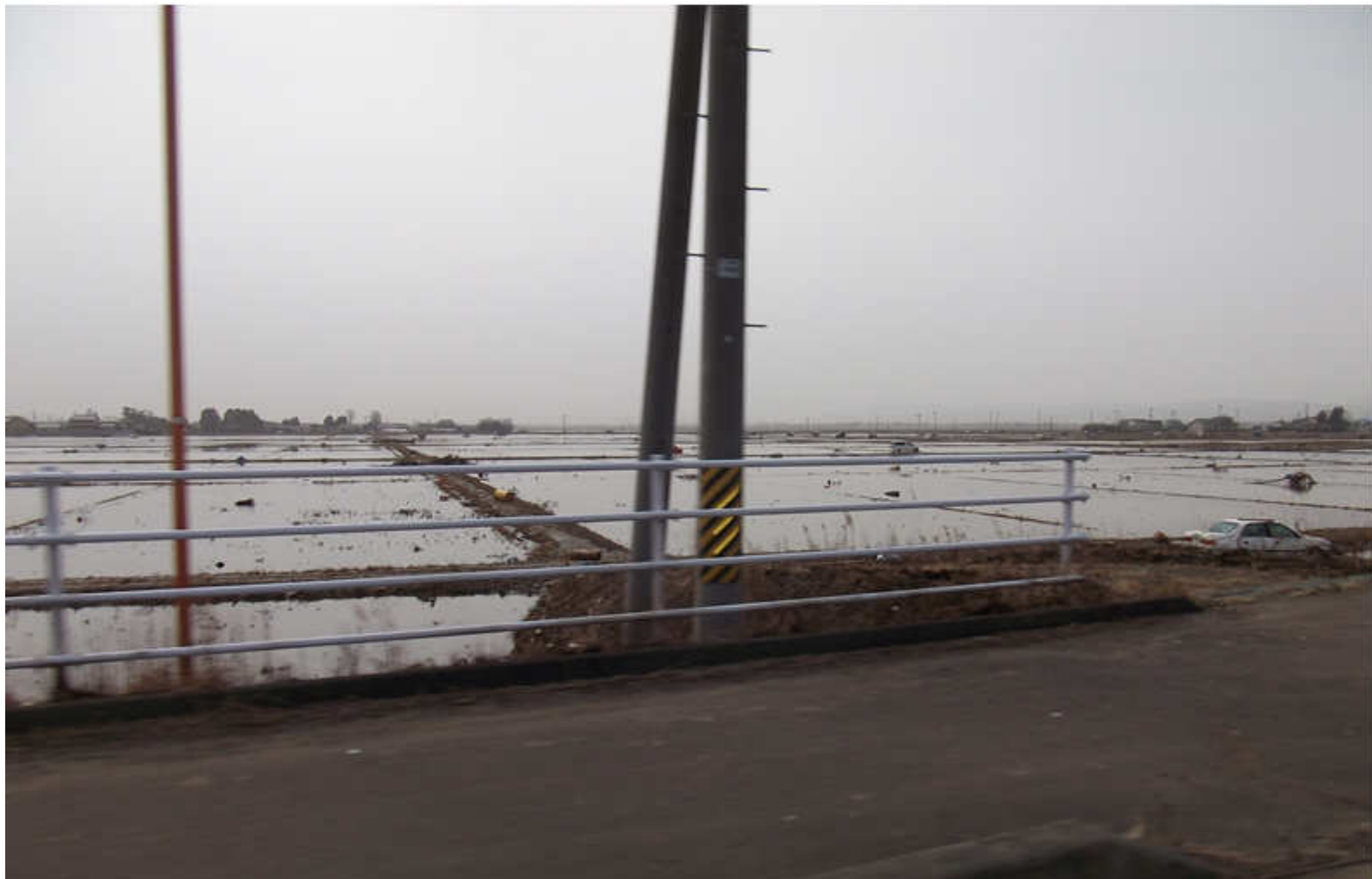
1-3 津波にのまれた仙台空港周辺の水田地帯 （海岸から5km地点、中には流された車もみえる）