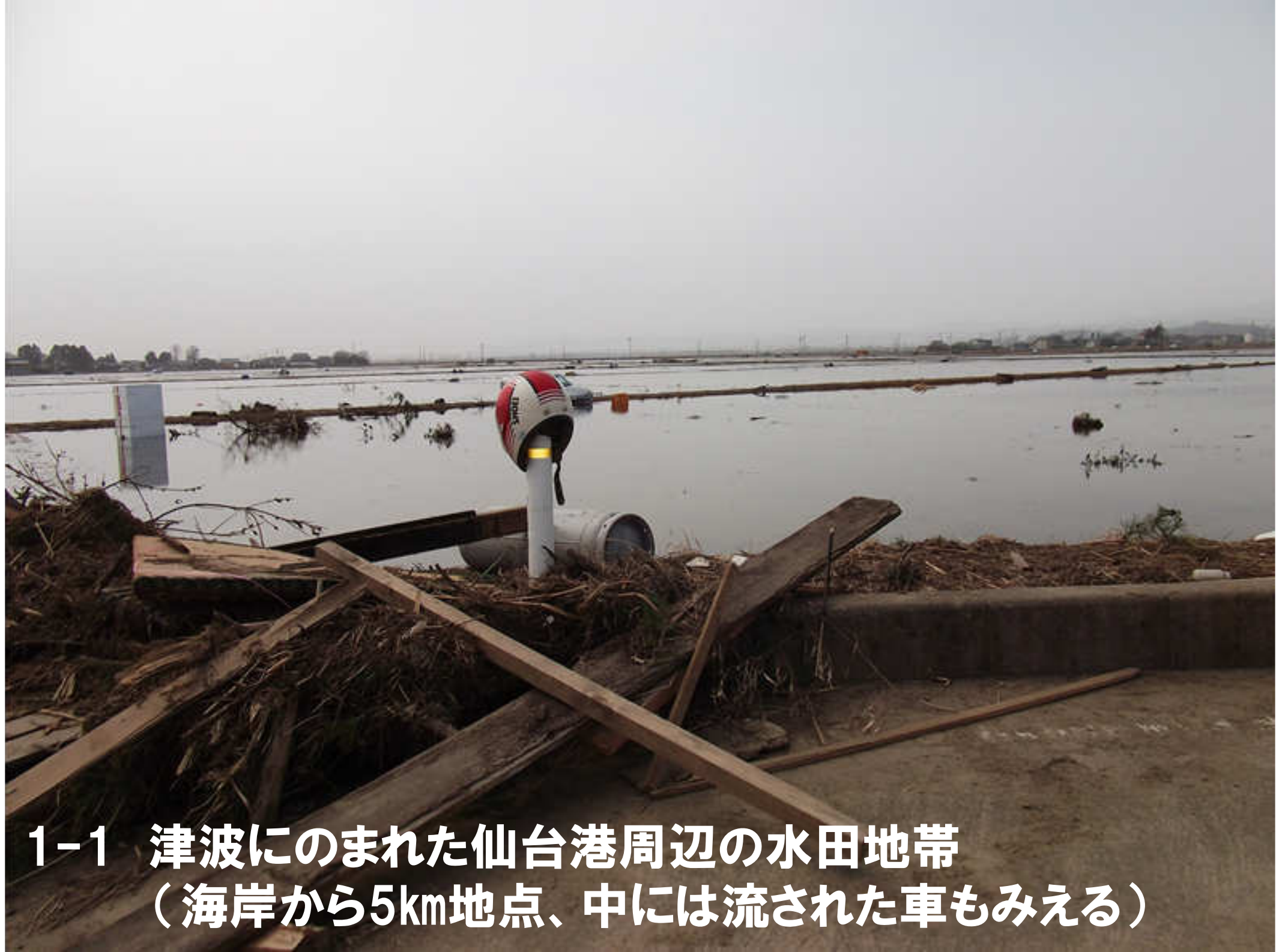
1-1 津波にのまれた仙台港周辺の水田地帯 (海岸から5km地点、中には流された車もみえる)