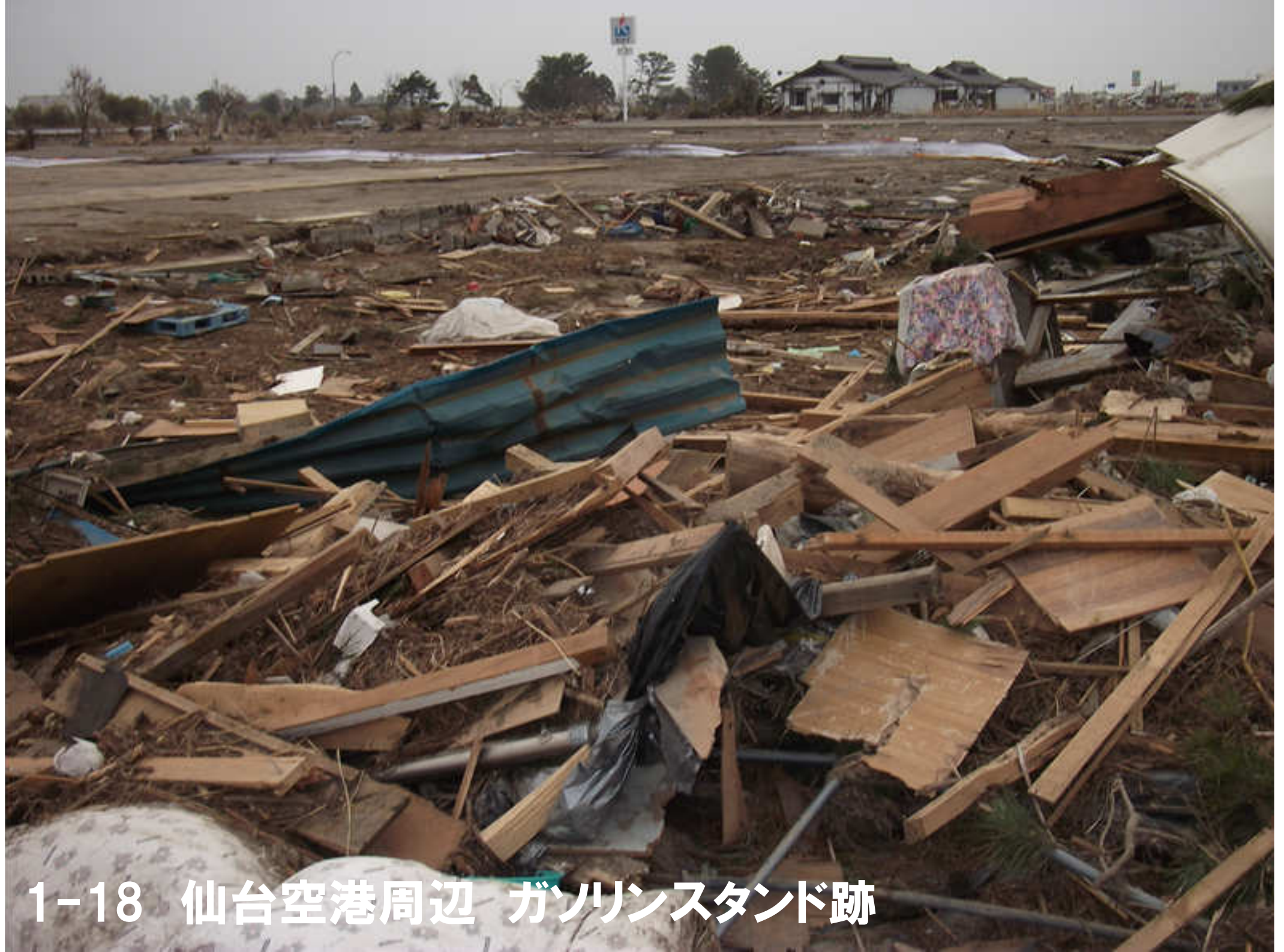
1-18 仙台空港周辺 ガソリンスタンド跡