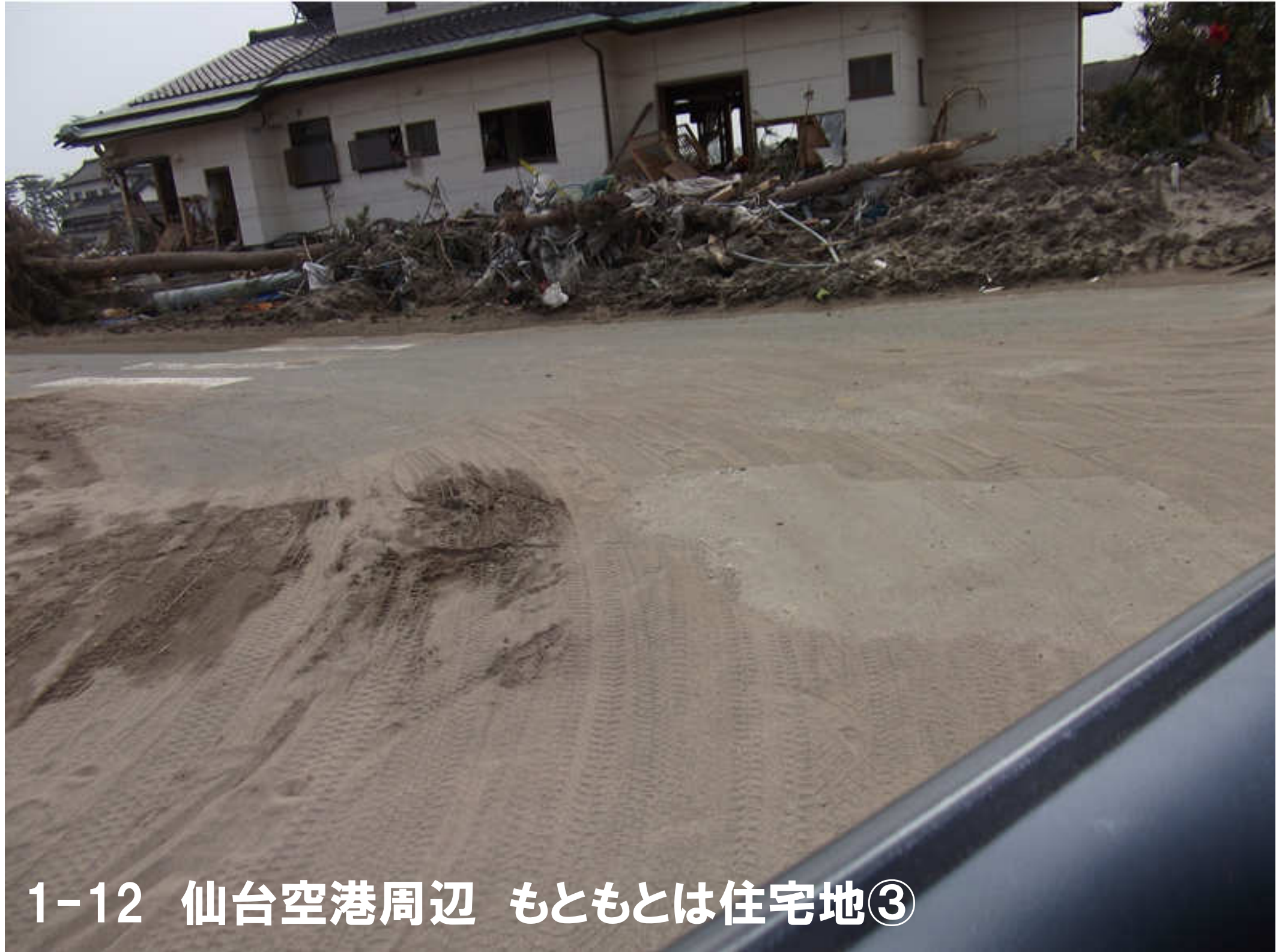
1-12 仙台空港周辺 もともとは住宅地③