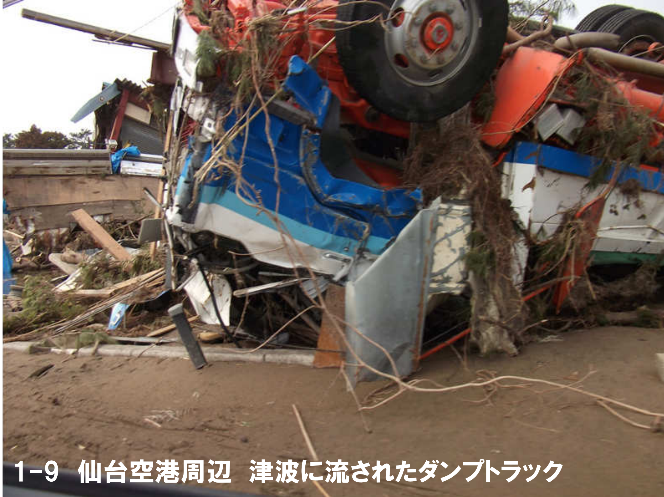
1-9 仙台空港周辺 津波に流されたダンプトラック