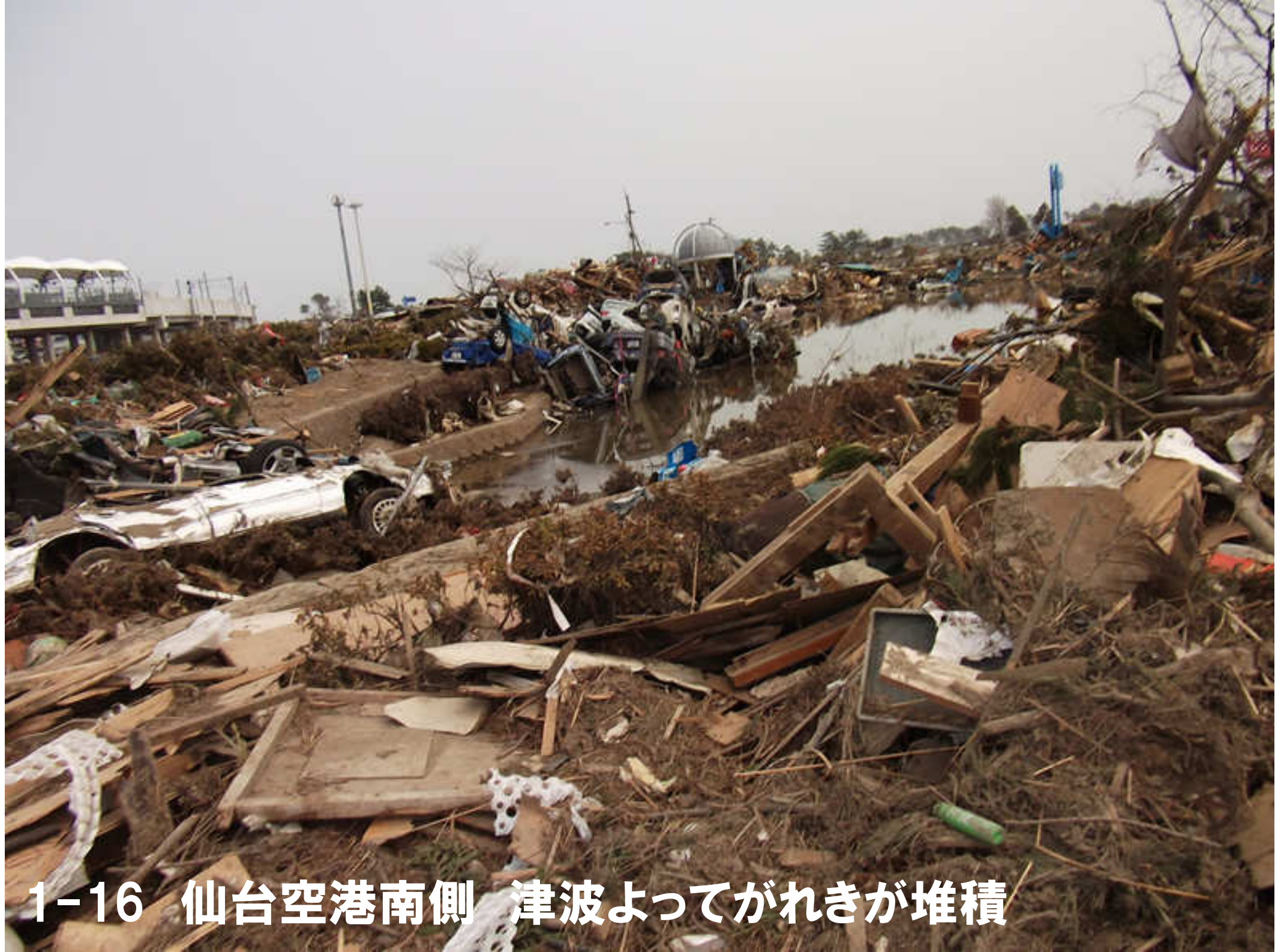
1-16 仙台空港南側 津波よってがれきが堆積