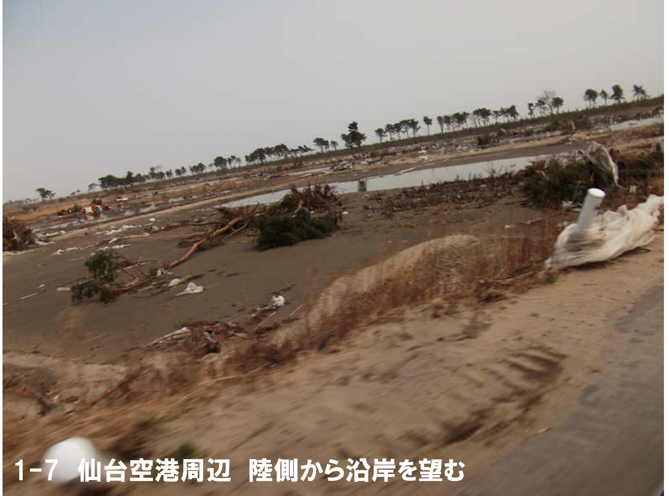
1-7 仙台空港周辺 陸側から沿岸を望む