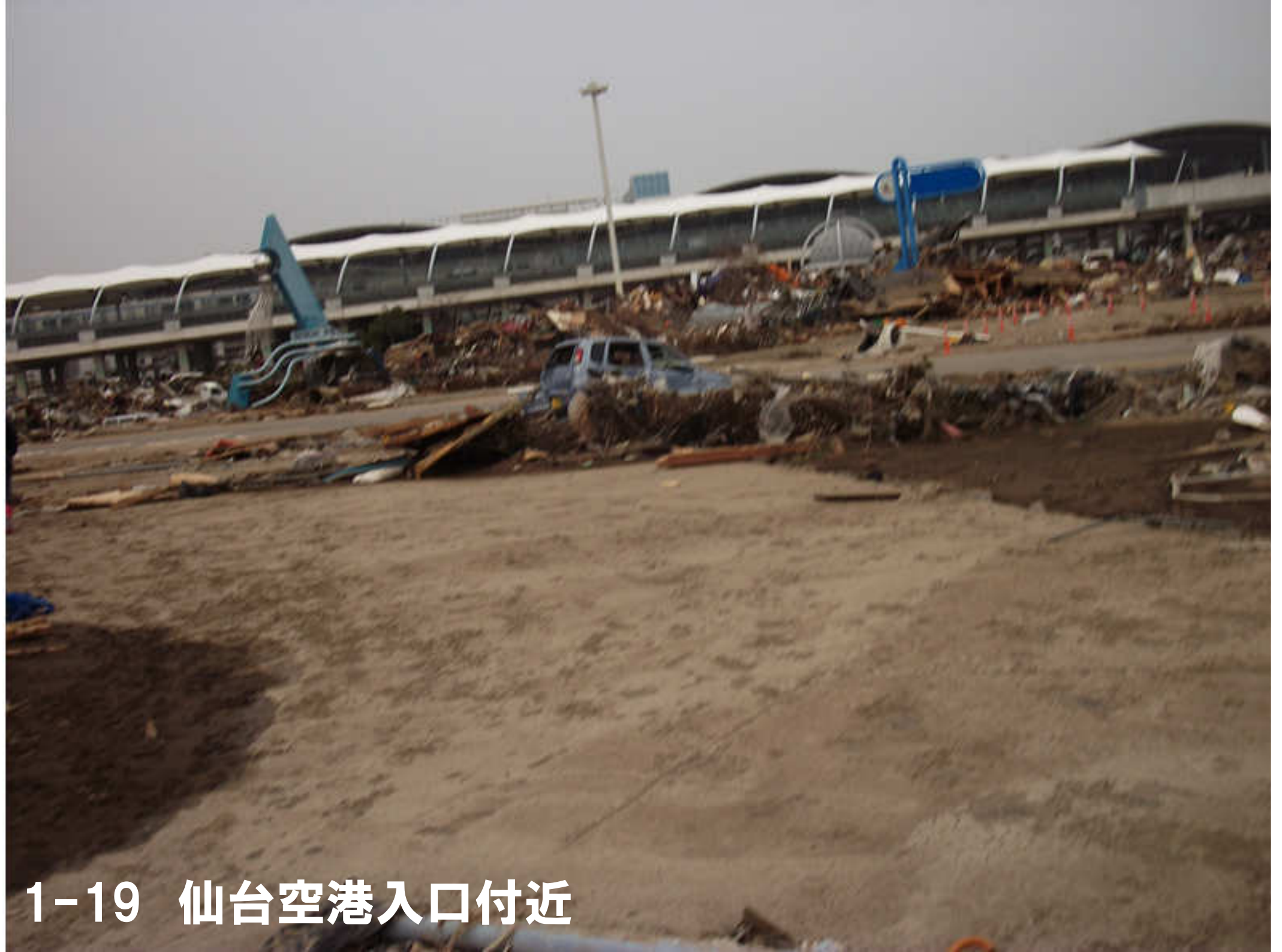
1-19 仙台空港入口付近